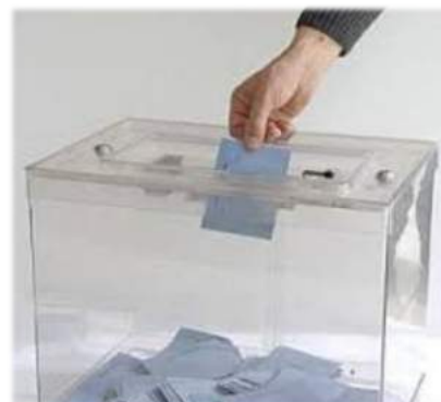
Le bureau de vote sera ouvert de 8 à 19h.

1er tour : 11 juin 2017 - 2nd tour : 18 juin 2017