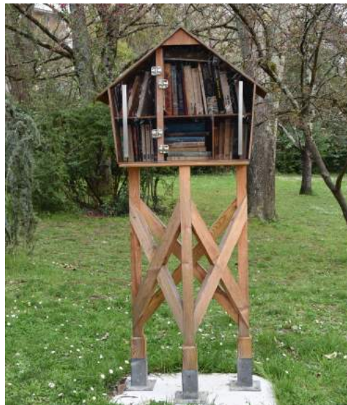
Boîte à lire à le Tourne

La seule contrainte, c'est que ces réceptacles devront être constitués à partir de matériaux recyclés et étanches - car bien sûr le papier n'aime pas l'eau.